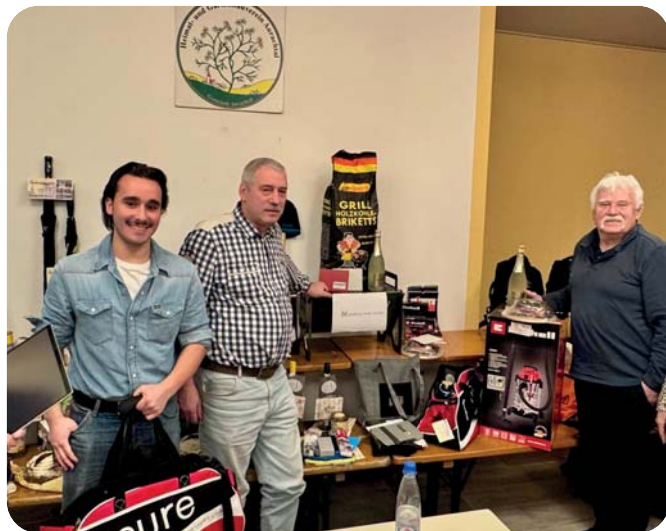
Die Gewinner des diesjährigen Muckturniers.

Im nächsten Jahr starten wir wieder mit dem Turnier.