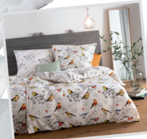
Mako-Satinbettwäsche 135/200 statt 79,95 € jetzt 59,95 €