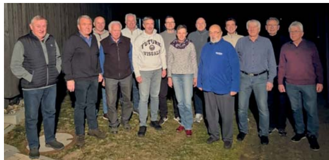
Bild: Der neu gewählte Vorstand mit allen Beisitzern und Kassenprüfern

Neu gewählt wurden unter anderem zwei Beisitzer, die frische Ideen in die Vorstandsarbeit einbringen wollen. In der Versammlung wurde zudem angeregt, künftig verstärkt Angebote für jüngere Mitglieder zu schaffen, etwa durch die Einsetzung eines Jugendleiters und neue gemeinschaftliche Aktivitäten. Diese Vorschläge sollen in den kommenden Vorstandssitzungen weiter konkretisiert werden.