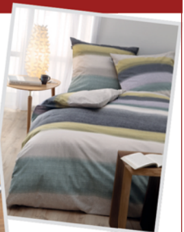
Feinbiber Bettwäsche 135/200 statt 49,95 € jetzt 39,95 €